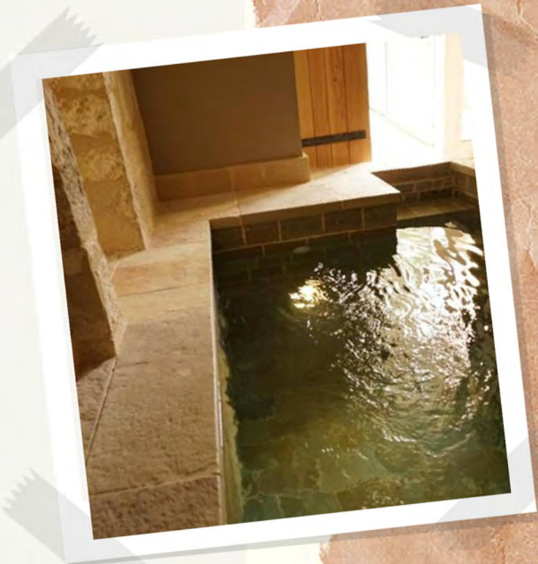
La piscine intérieure